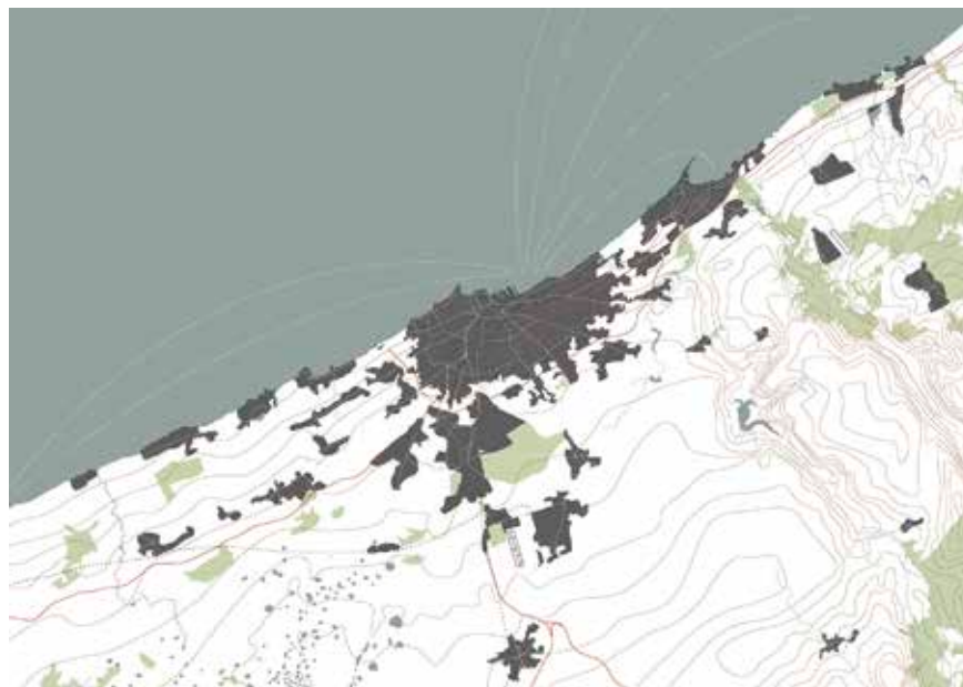
Casablanca, « La Fabrique du territoire », dir. L. Hodebert, étudiants : J. Bracco, B. Coëz, A. Fatichi, L. Gaynard, S. Gouirand, I. Maire, P. Taly.

Dans le cadre de l'exposition « Connectivités » présentée au MuCEM, les étudiants de l'École nationale supérieure d'architecture (ENSA) de Marseille ont cartographié quatre métropoles-mégalo-poles au sein du séminaire « La fabrique du territoire », sous la direction