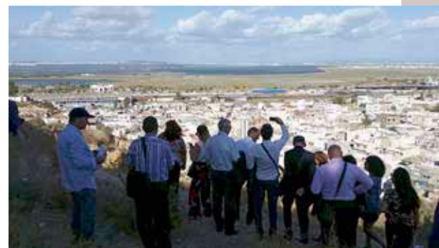
Séminaire à Tunis en septembre 2017

Au sein du Grand Tunis, les processus informels, indifférents aux injonctions des marchés et aux normes de la planification, correspondent à 25% de l'urbanisation. Leurs conséquences négatives sont nombreuses : consommation des terres agricoles, absence d'équipements, dégradation de l'environnement... Illégale, la