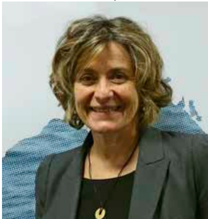
© Gérard Tur, directeur de la publication Econostrum

Dans le même temps, les espaces métropolitains offrent d'importantes opportunités de résilience territoriale face au changement climatique. Par la mise en scène du grand territoire, ils donnent la possibilité de concevoir un développement urbain à partir des espaces ouverts, agricoles et naturels. De nouveaux accords d'un projet ville-nature enrichissent la seule réponse