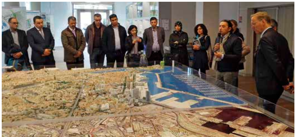
Présentation du projet Euroméditerranée à Marseille